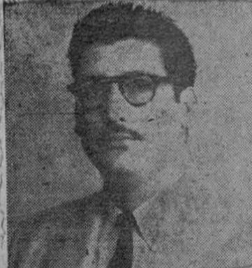
Diputado Guillermo Villalobos