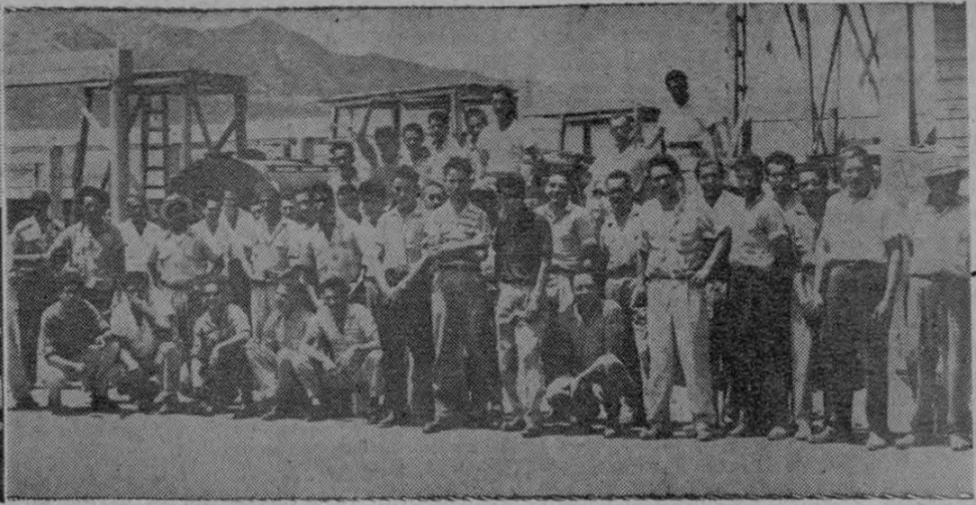
MOP en esta ciudad al decretarse la nueva huelga general. Los trabajadores fueron al paro porque una vez más no les